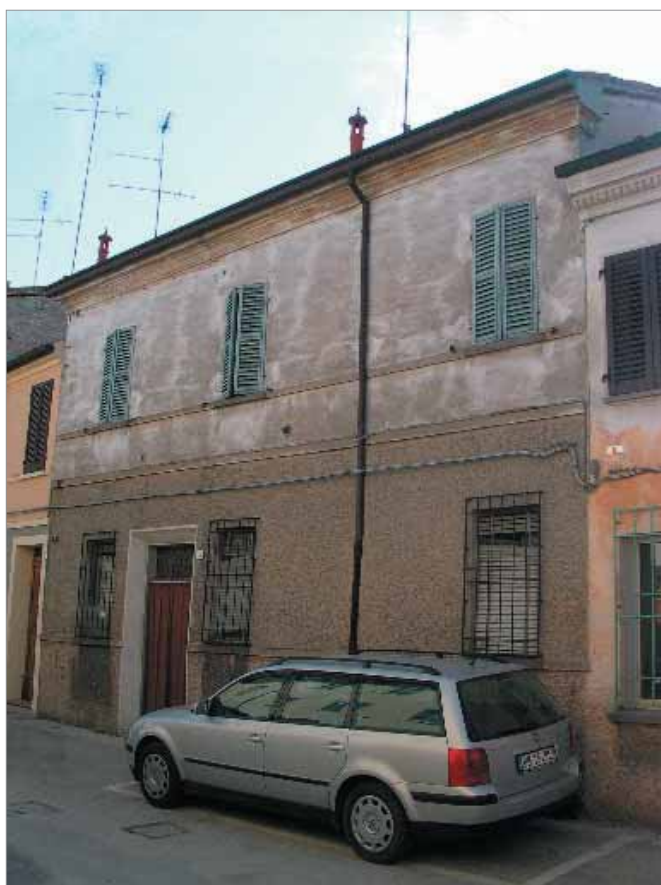
Via Verdi 15 Fronte Principale